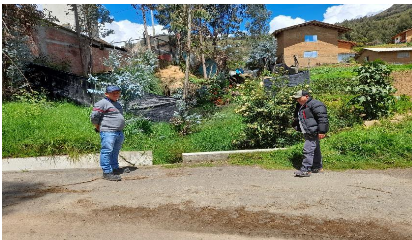
IMAGEN N°01: Se observa la quebrada Coipin que requiere de mantenimiento