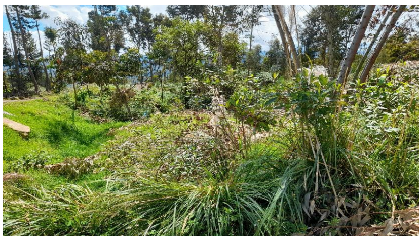
IMAGEN N°02: la quebrada Coipin se encuentra colmatada y con vegetación densa